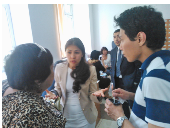
Специалисты ТОО «Региональный технопарк г.Астаны» проводят консультацию ученым университета по технологическому бизнес-инкубированию во время кофе-брейка

После основных докладов состоялся конструктивный диалог между учеными университета и представителями АО «НАТР» и ТОО «Региональный технопарк г.Астаны» по вопросам коммерциализации инновационных проектов.