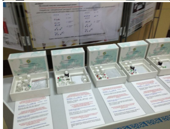
Выставочные стенды КАТУ им. С.Сейфуллина по научно-инновационной деятельности