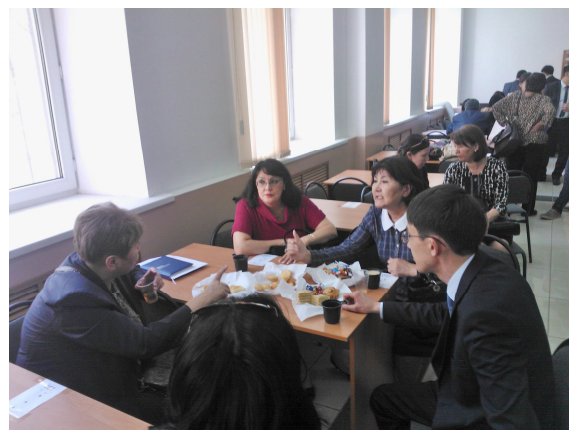
Специалисты АО «НАТР» проводят консультацию ученых университета по финансовым инструментам поддержки инновационной деятельности во время кофе-брейка