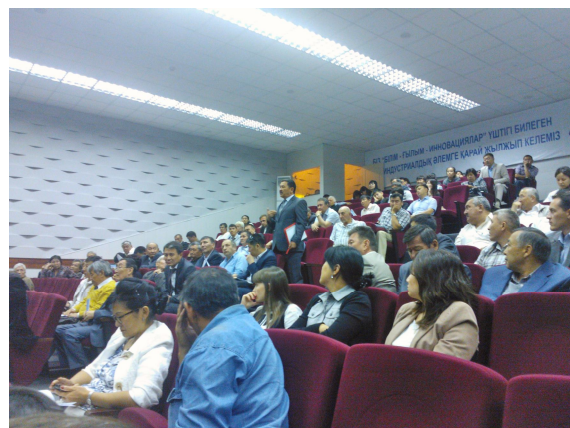
Ученые университета задают вопросы докладчикам