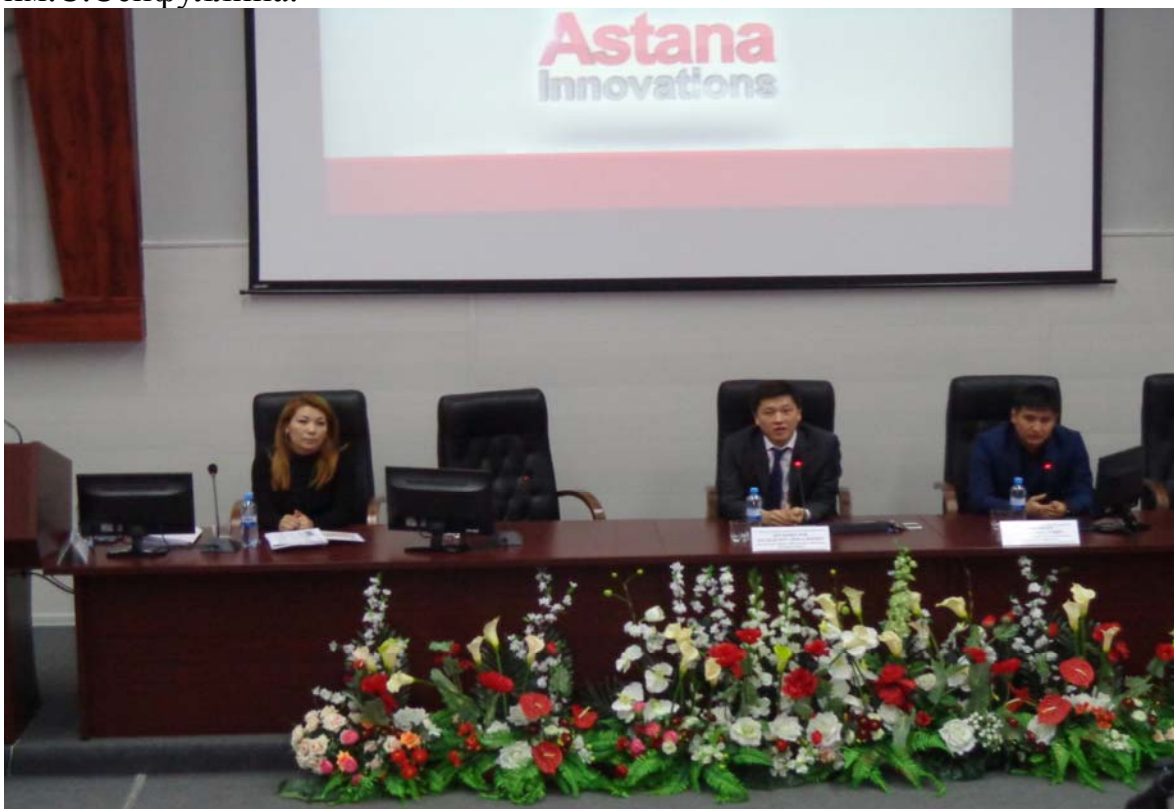
Презентация деятельности АО «Астана Innovations»

Учитывая опыт компании в поддержке инноваций для успешной реализации проектов и внедрения передовых технологий, офис коммерциализации будет продолжать деятельность по дальнейшему совместному сотрудничеству с АО «Астана Innovatoins» в целях продвижения и коммерциализации научных разработок КазАТУ им.С.Сейфуллина.