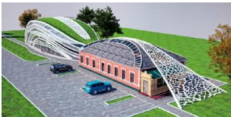
Рисунок 3 – Модель новой концепции

При первом взгляде на данный проект, замечается тонкость и изящество белых железных конструкции. Все железные конструкции закручиваются и соединяются, плавно перетекают от одной структуры в другую. Композиция объекта имеет некую стилизованность растения. Безусловно, конструкции и материал нового корпуса чужды характеру существующего объекта. Но, не смотря на этот факт, здание уместно гармонирует с ним. Так как каждый элемент нового проекта своей контрастностью выявляет наилучшие качества существующего объекта.