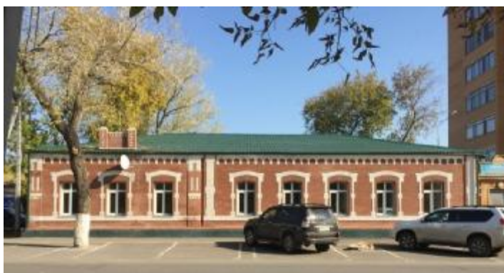
Рисунок 1 – Фрагмент фасада существующего положения

Декоративная кладка с высоким мастерством применена по всем элементам фасада, обогащая, подчеркивая и художественную выразительность целого. Умело прорисовано цокольная часть, зрительно завершающаяся широкой полкой, объединяющей все оконные проемы. Развитый цоколь, удлиненные обрамления окон и богатый карниз зрительно увеличивает высоту здания.