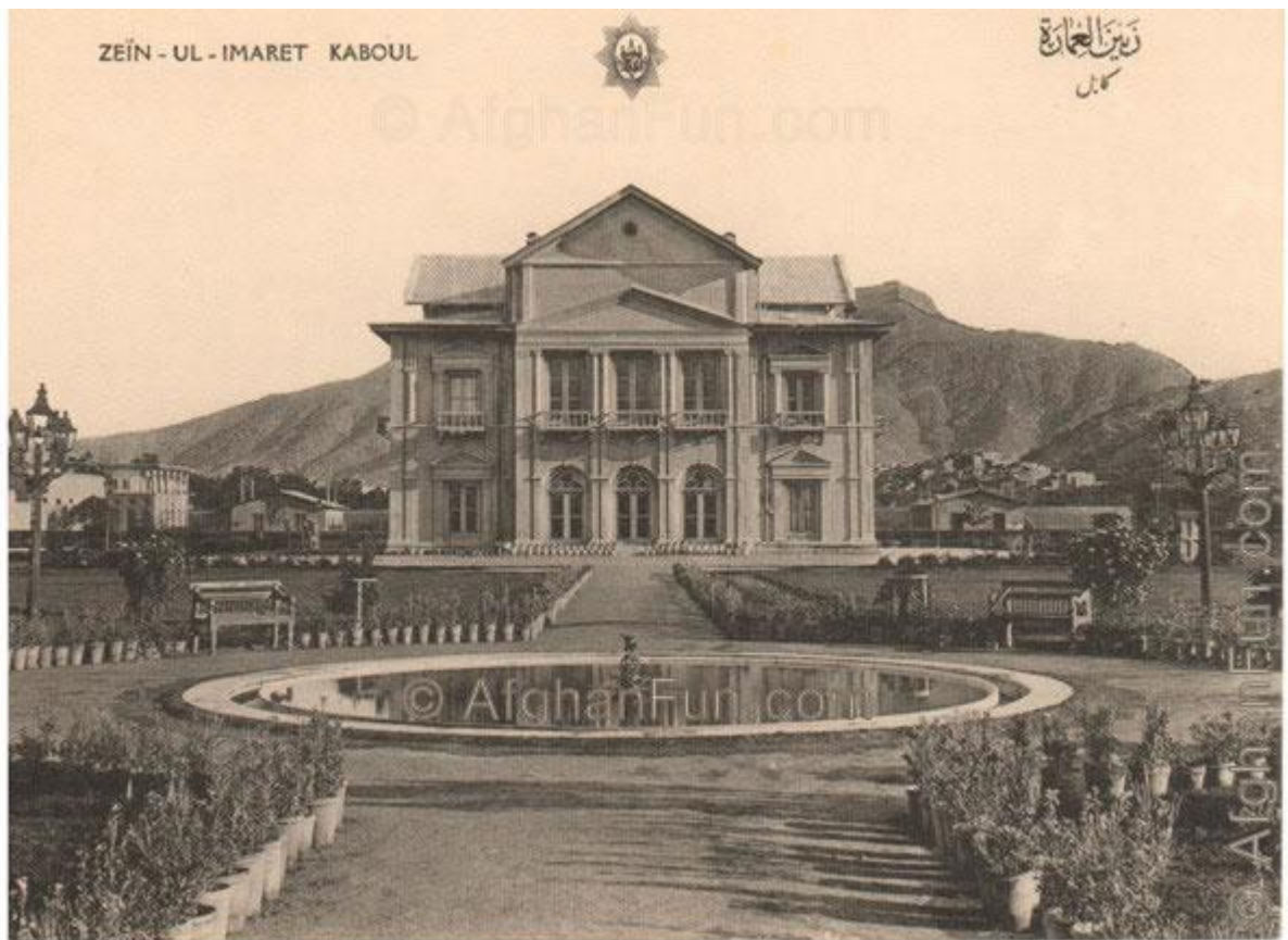
Zain-ul-amarat “великолепное Здание”

Чтобы улучшить качество архитектуры в Афганистане, афганцы должны знать об окружающей среде и традиционной архитектуре вместо того, чтобы строить здания пирага и догматические здания использования энергии.