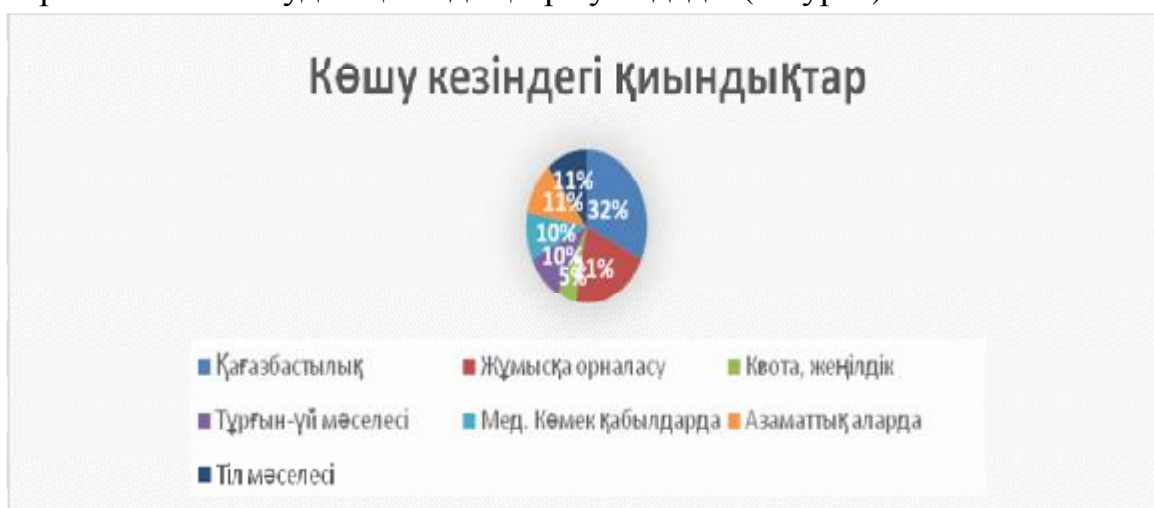
2-сурет. «Көшу кезіндегі қиындықтар атаулары»

Респонденттердің 87%-ы жергілікті халықпен қатынаста қиындық тұмайды және қазақ тілді және орыс тілді көршілерімен бірдей дос. Алайда жаңа тұрғылықты орнына бейімделу кезеңінде маңызды қиындық ретінде респонденттердің 32%-ы бюрократия/қағазбастылықты атайды, респонденттердің 21%-ы жұмысқа орналасудағы қиындықты атайды, 11%-ында орыс тілін білмеуден қиындықтар туындайды (2-сурет).