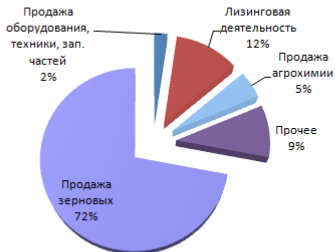
3 рисунок- Бизнес АО "Холдинг КАЗЭКСПОРТАСТЫК"

Бизнес АО "Холдинг КАЗЭКСПОРТАСТЫК" в 2011 году был представлен таким образом (выручка): Всего $ 359 млн.