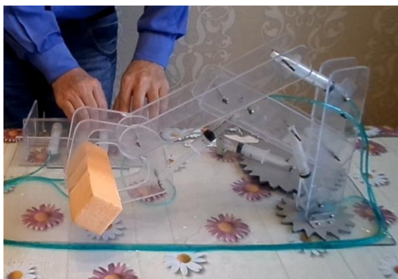
Сурет 3 – Механикалық роботтың кескіні

Робототехника механика, радиотехника, электротехника, электроника және информатика ғылымдарына сүйенеді. Ал шаруашылық саласына сәйкес құрлыс, өнеркәсіп, тұрмыстық, авиациялық, космостық, су асты және т.б. робототехникаларға бөлінеді.