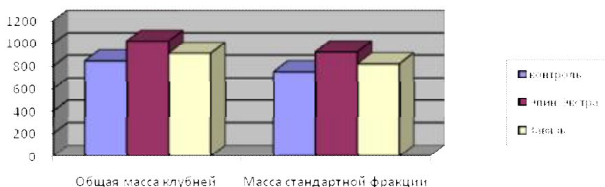
Рисунок 2 – Влияние стимулирующих обработок на среднюю массу клубней куста картофеля

В результате исследований пришли к выводу, что использование регулятора роста Эпин-Экстра в большей степени способствует повышению как массы клубней в кусте, так и количества клубневых единиц. При использовании регулятора роста Эпин-Экстра урожайность картофеля по сравнению с контролем (450 ц/га) увеличилась соответственно на 105 ц/га