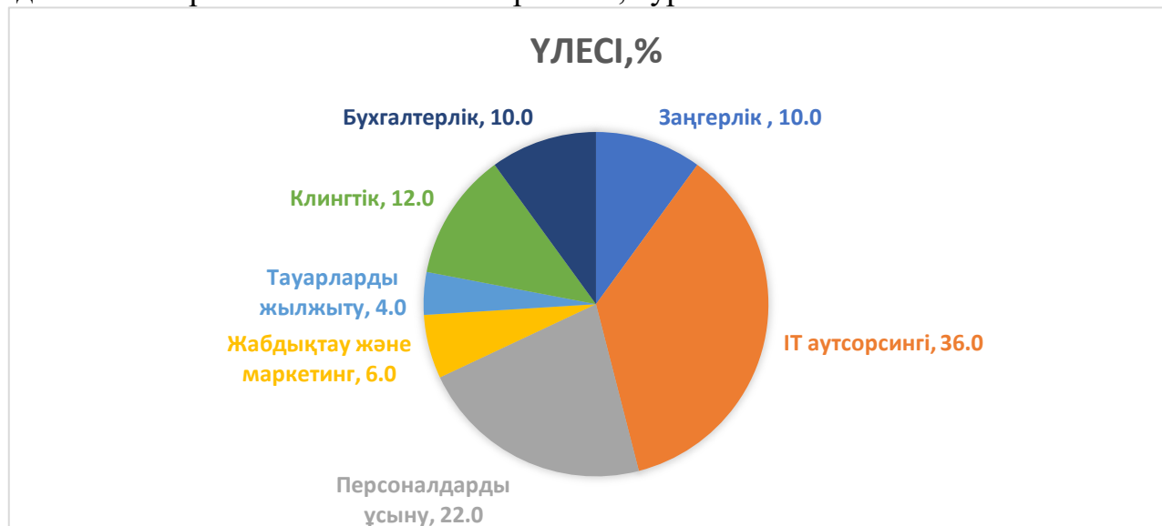
Сурет 2. Аутсорсинг қызметтері бойынша топтастыру

Қазақстанда қазіргі кезде жұмыс істейтін аутсорсингтік компаниялары мынадай бағыттары бойынша топтастырылған, сурет 2.