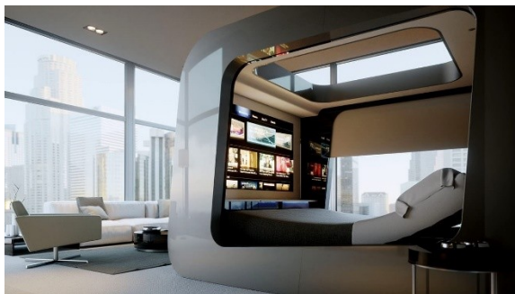
Рис.2 Дизайн интерьера в стиле «Хай-тек».

В 70-х годах в Европе появляется стиль «Хай-тек», где основным принципом является отсутствие рациональности и декора. Наличие предметов из металла считается главной особенностью тенденцией интерьера в стиле хай-тек. Металлические трубные шкафы, металлическое основание дивана и другие предметы мебели (рис. 2), [7], . Полы, как и стены, должны быть прочными. И наличие геометрического или растительного узора, или орнамента никоим образом не допускается.