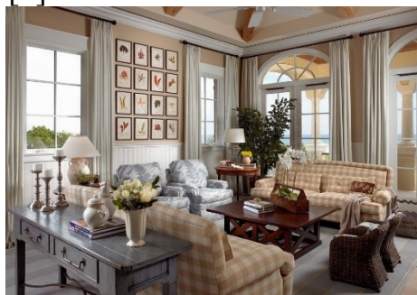
Рис.3 Дизайн интерьера в стиле «Кантри».

Американский ранчо, горный шале, русская изба – все это включает в себя стиль «Кантри». Особенностью стиля кантри является – тепло и уют. Мягкая мебель, которая не отличается модным дизайном, скорее наоборот, она более примитивна, «старая» и, местами, грубая. Деревянные полы, расписные тарелки как элемент декора и, конечно же, узнаваемая особенность стиля - клетка из текстиля, в которой нет никаких сложных, витых украшений, все просто и легко (рис. 3), [8].