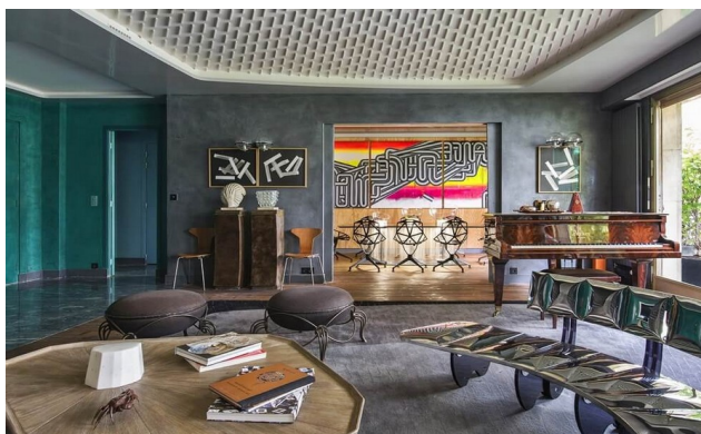
Рис.5 Дизайн интерьера в стиле «Постмодернизм».

Последний из самых ярких стилей - постмодернизм. Стиль, который характеризуется отказом от стереотипов, некоторых канонов и рутины. Особенности являются яркие цвета, орнаменты, символика форм и контрастные сочетания текстур и фактур (рис. 5), [10]. Как правило, для этого стиля подходят просторные комнаты с простой планировкой. Но он больше подходит для ресторанов, клубов, салонов или квартир с открытой планировкой.