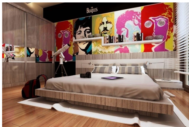
Рис.4 Дизайн интерьера в стиле «Поп-арт».

что яркие пятна иногда могут надоесть, но, тем не менее, поп-арт был и остается одним из модных стилей при создании дизайна интерьера.