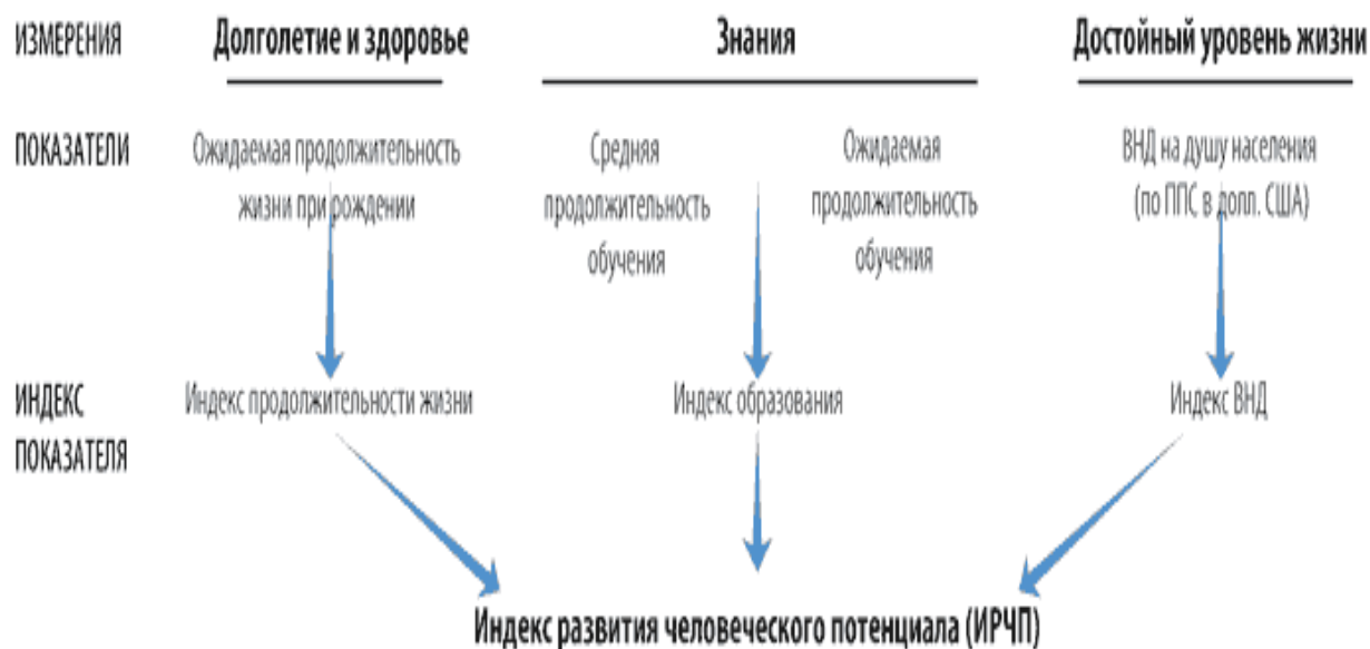
Рисунок 1. Вычисление ИЧР

3) реального объема ВВП в расчете на душу населения (в долларах США на основе паритета покупательной способности) (П). [3]