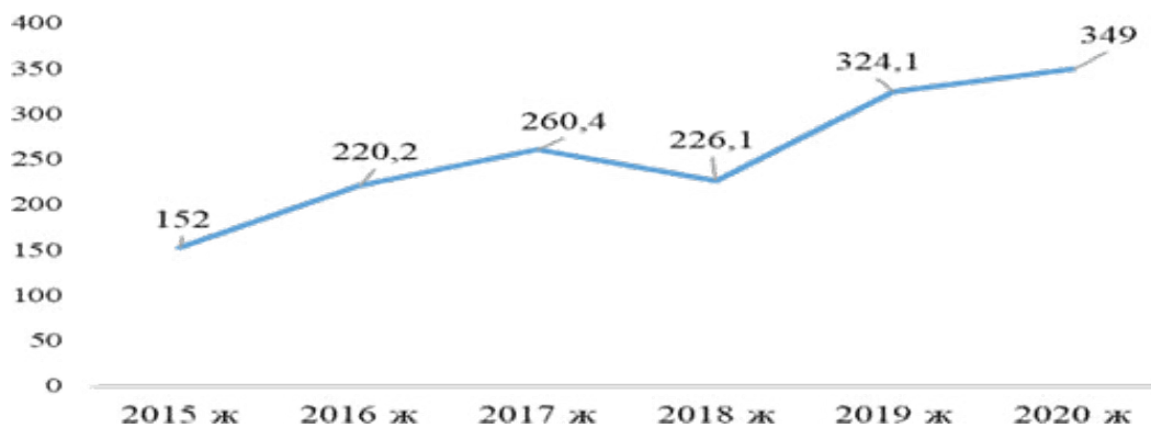
Сурет 2 - ҚР-да ауыл шаруашылығын субсидиялауға бөлінген қаражаттар, млн тг

Бүкіл әлемде кәсіпорындарға қаржы ресурстарын беруде артықшылық несиелеу