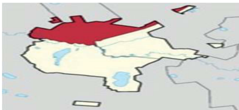
Рисунок- 2 Район Сарыарка

Самая длинная улица столицы – Қабанбай батыра (9.4километра). Проспект Кабан- бай-батыра находится в Есильском районе Нур-Султана между мостом через Ишим и кольцевой развязкой по шоссе Каркаралы (Рождественское шоссе). Начинается со съезда с моста, пересекает слева — улицу Космонавтов, справа —Кургальджинское шоссе, пересекает улицу Сарайшык, улицу Динмухамеда Кунаева, Водно-зелёный бульвар, про-спект Достык, улицу Сыганак, улицу Алматы и трассу на аэропорт, продолжается в виде шоссе Каркаралы (Рождественское шоссе), в города Темиртау, Абай, Караганда.