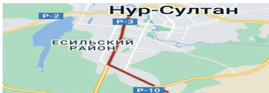
Рисунок 3 - Проспект Кабанбай батыра

Самая длинная улица столицы – Қабанбай батыра (9.4километра). Проспект Кабан- бай-батыра находится в Есильском районе Нур-Султана между мостом через Ишим и кольцевой развязкой по шоссе Каркаралы (Рождественское шоссе). Начинается со съезда с моста, пересекает слева — улицу Космонавтов, справа —Кургальджинское шоссе, пересекает улицу Сарайшык, улицу Динмухамеда Кунаева, Водно-зелёный бульвар, про-спект Достык, улицу Сыганак, улицу Алматы и трассу на аэропорт, продолжается в виде шоссе Каркаралы (Рождественское шоссе), в города Темиртау, Абай, Караганда.