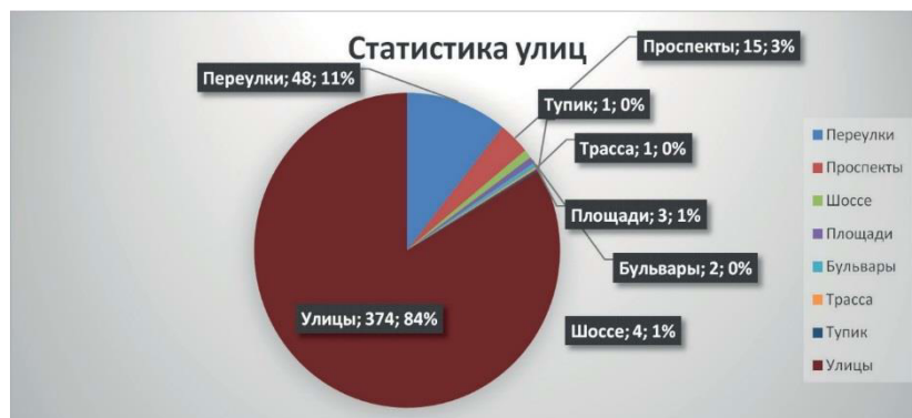
Диаграмма–1 Статистика улиц

Результаты и обсуждения: Как выяснилось по нашим исследованием, в столице всего 448 улиц, проспектов, переулков, шоссе и т.д.