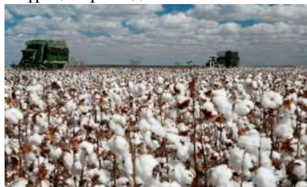
1 сурет -Мақта шаруашылығының өсу барысы

Бізде мақтаны өсіру барысында көптеген дәрілер қолданылады және мақтаны құрт жеп қоймас үшін дәрі себіледі.Енді тамыздың аяғы,қыркүйектің басында мақта терімі басталады.Адамдар немесе тракторлар арқылы тергізеді. Мақтаның бағасы 2021 жылы бір келісінің бағасы 320-380 теңге аралығында болған.2022ж ауыл шаруашылығы дақылдары 859,9 мың гектарға орналастырылып,өткен жылмен салыстырған