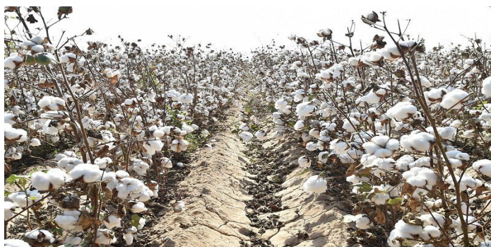
2 сурет - Мақта дақылының терімге дайын уақыты

Мақтаны енді Хлаб завотқа өткізіп,шитін бөлек,мақтасын бөлек алады.Мақтадан ар қарай жіп иіріп киім тігеді немесе көрпе-төсек жасайды.Негізі алғанда мақта өте пайдалы өнім.Оның шитін алып қайтадан мақта өсіреді,мақтасынан жіп иіріп киім тігеді немесе көрпе-төсек жасайды,қозапаясын отын қылып жағып үйін жылытады.Мақтаны адамдар жерін жақсарту үшін де егеді,былайша айтқанда оның қауашақтары жерді құнарландырады.Шитті мақтаны терең өңдеп, дайын талшық өндіретін зауыт Шымкенттегі мата шығаратын екі комбинатты дайын өніммен қамтамасыз етіп отыр. «Ақ алтынның» отаны саналатын Мақтаарал ауданында мақта өндіретін 6 кәсіпорын бар. Солардың ішіндегі мақта талшығын терең өңдейтін іргелі өндіріс орындарының бірі – осы «Мырзакент» мақта өңдеу зауыты. Мақтаарал ауданында мақта өндіретін 5 зауыт және мақта қабылдайтын 69 бекет қызмет көрсетуде. Зауыттардың ішінде ТМД-да теңдесі жоқ саналатын «Мырзакент» мақта өңдеу зауыты 120 адамды тұрақты жұмыс орнымен қамтып отыр.