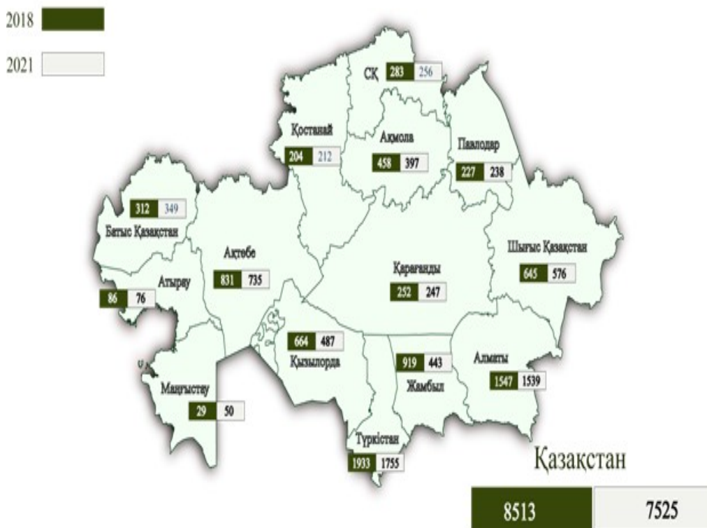
Сурет 2 – Қазақстан өңірлері бойынша ауыл шаруашылығы кооперативтеріндегі қызметкерлерінің саны, адам

Атап айтқанда, ауыл шаруашылығы кооперативтерінде 2021 жылдың соңында 7,5 мыңнан астам адам еңбек етті. Жалпы 2018-2021 жылдар аралығындағы кооперативтердің даму жағдайын сипаттайтын болсақ, 2018 жылы 2021 жылмен салыстыр салыстырғанда ауыл шаруашылығы кооперативтерінің саны 10%; өндіріс көлемі үш еседен астам артты. Дегенмен, көрсетілген қызметтер көлемі 24%; ал 1 мыңнан астам адамға немесе 12% аз. де 12% және азайды.