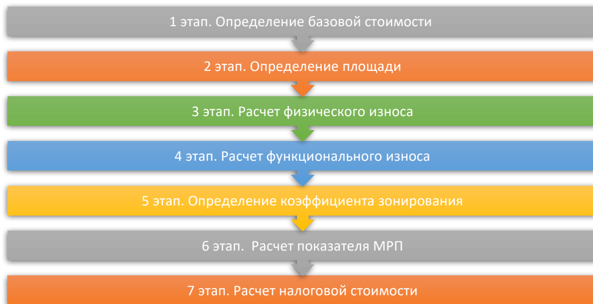
Рисунок 3 - Этапы определение налоговой стоимости

Так же, требуется совершенство налогового законодательства, в частности, налога на имущество (налоговой стоимости для налогообложения), который рассчитывается по формуле в 529 статье Налогового Кодекса РК.