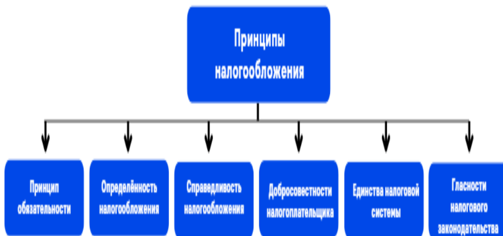
Рисунок 1 - Принципы налогообложения

В соответствии с законодательством Республики Казахстан, процесс налогообложения осуществляется на основе установленных норм. Согласно пункту 1 статьи 4, налогообложение включает в себя определенные принципы: