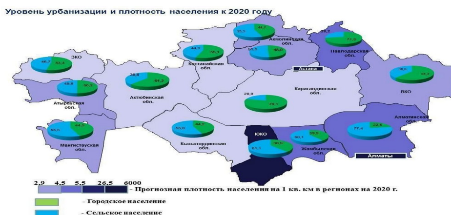
Рисунок 1- Структура городского и сельского населения Казахстана

В последние годы обеспечение социальной устойчивости стало глобальной проблемой для устойчивого городского развития, как в академической сфере, так и в науке об устойчивости [1]. Исследования ряда ученых доказывают, что «существуют особые проблемы рынка труда в малых городах, их отличает экономическая неустойчивость и социальное неблагополучие, связанное с падением реальных доходов населения. Многие предприятия по-прежнему остаются территорией с очень низким уровнем оплаты труда, находятся в глубоком кризисе. Несмотря на выгодное экономико-географическое положение в ряде случаев и наличие развитой инфраструктуры, инвестиции в города не поступают или поступают в ограниченном объеме, модернизация производства происходит за счет собственных средств предприятий. Многие предприятия испытывают недостаток трудовых ресурсов, но привлечь последние в настоящее время практически невозможно из-за низкой заработной платы и отсутствия социальных льгот» [2]. (рисунок 1).