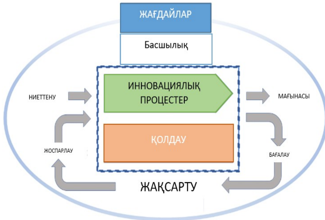
Сурет 2. Инновацияларды басқару жүйесінің негізгі құрылымы

Сондықтан ішкі және сыртқы білімнің арқасында түсініктерді қалай пайдалану керектігін, белгісіздікті басқаруды, мүмкіндіктерді бағалау және онымен байланысты тәуекелдерді басқару үшін білікті инновациялық серіктестіктер құруды білу қажет.