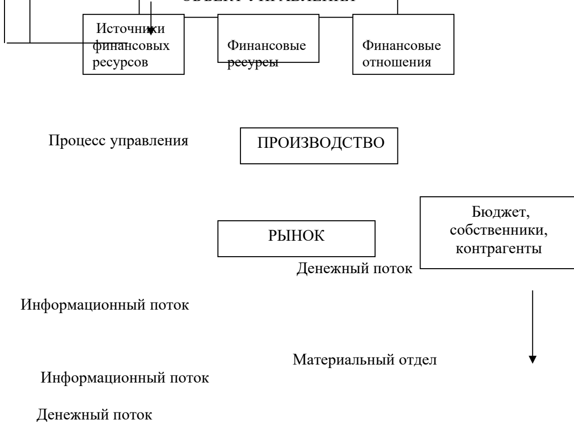
Рисунок 1. Структура и процесс функционирования системы управления на предприятии

В рамках первого направления осуществляется общая оценка: